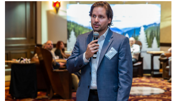
Congrès des Décideurs