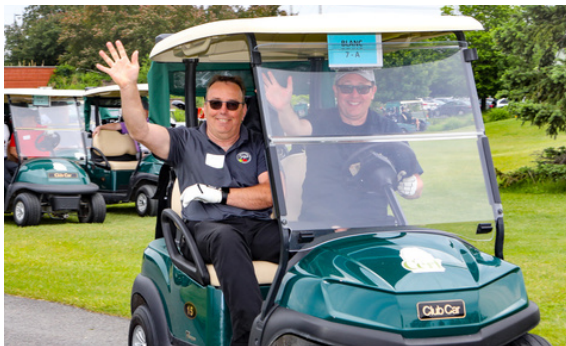
Journée de golf