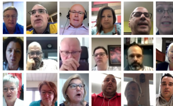
Assemblée générale annuelle